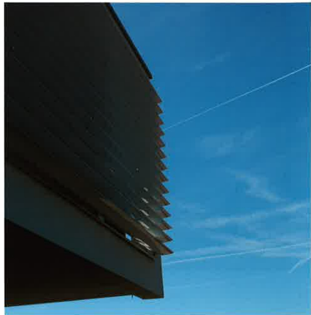
Détail de brise soleil